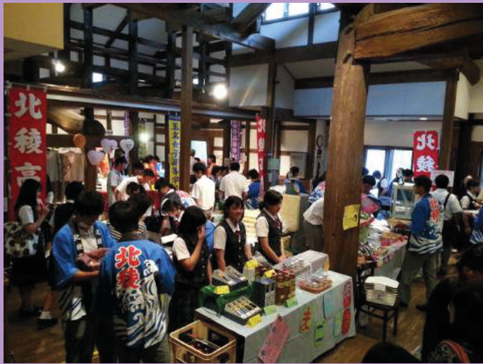
いらっしゃいませー！の掛け声