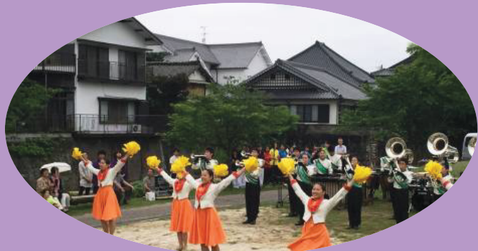
裏川でのイベント広報隊！