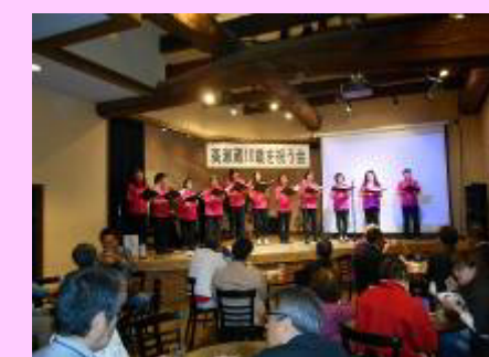
カントアモローソ