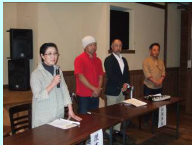
新執行部での挨拶