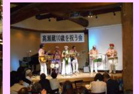
マハロハワイアンズ