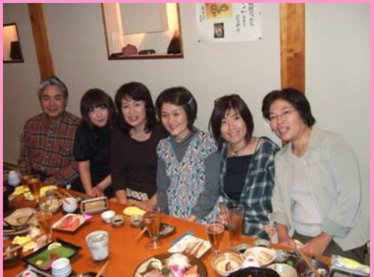
受付スタッフ（新旧）で記念撮影