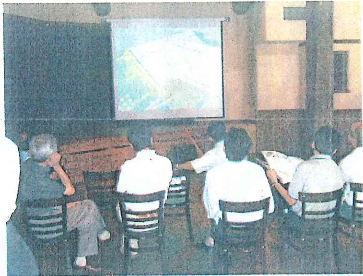
迫力ある大画面のスクリーン

ホールを使用しない、平日 11:00~16:00 に蔵を開放して高瀬蔵改修記録映像を放映しております。高瀬蔵の改修風景が大画面の迫力ある映像で写しだされ、お客様に大変好評です。お近くにお越しの際は、是非お立ち寄りくださいませ。(神永和典)